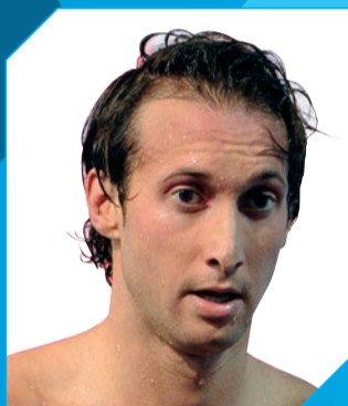
Fabien Gilot Champion du monde et olympique de natation